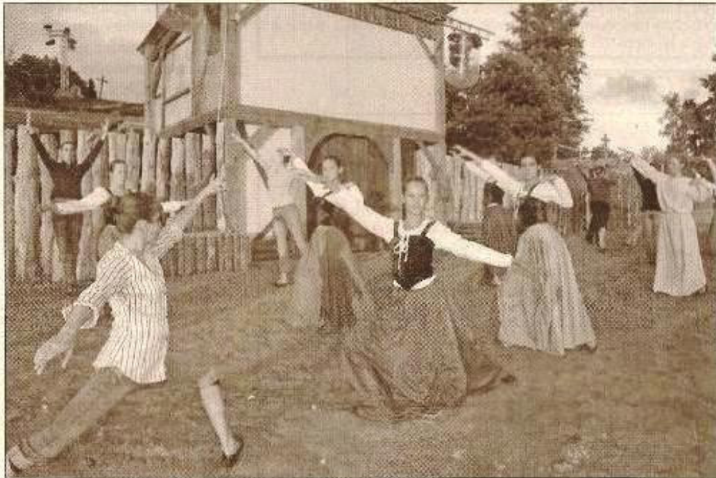
Nouveauté cette année, la participation du groupe Arabesque.

Le site du château de Bridiers a été reconquis dans une grande fresque nocturne : elle balie plus d'un siècle de l'histoire qui a marqué la région, trame d'une civilisation.